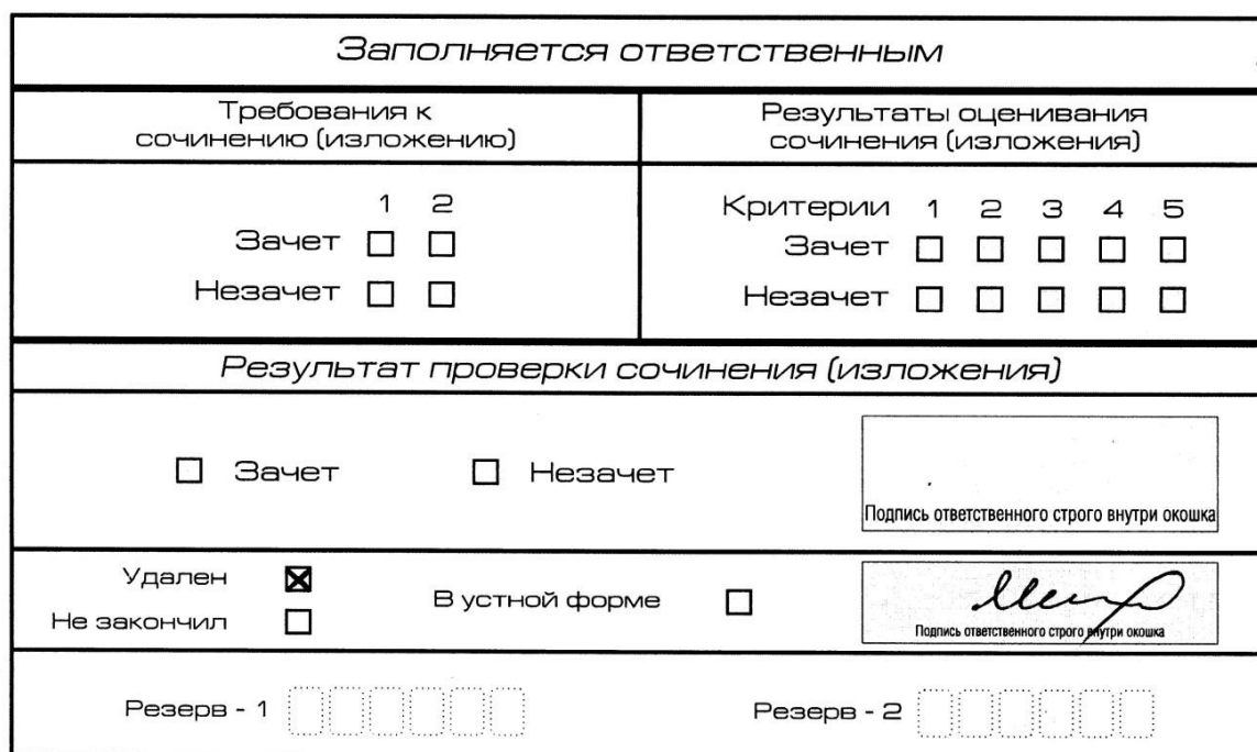
Рис. 13. Заполнение полей нижней части бланка регистрации (удаление с экзамена)

В случае если участник итогового сочинения (изложения) нарушил установленные требования, изложенные в пункте 28 Порядка проведения государственной итоговой аттестации по образовательным программам среднего общего образования (приказ Минпросвещения России и Рособрнанадзора от 4 апреля 2023 г. № 232/551), он удаляется с итогового сочинения (изложения). Член комиссии по проведению итогового сочинения (изложения) составляет «Акт об удалении участника итогового сочинения (изложения)» (форма ИС-09), вносит соответствующую отметку в форму ИС-05 «Ведомость проведения итогового сочинения (изложения) в учебном кабинете ОО (месте проведения)» (участник итогового сочинения (изложения) должен поставить свою подпись в указанной форме). В бланке регистрации указанного участника итогового сочинения (изложения) необходимо внести отметку «X» в поле «Удален». Внесение отметки в поле «Удален» подтверждается подписью члена комиссии по проведению итогового сочинения (изложения) (см. рис. 13).